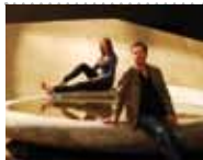
Metamorphosis sind zu Gast in Bad Salzhausen